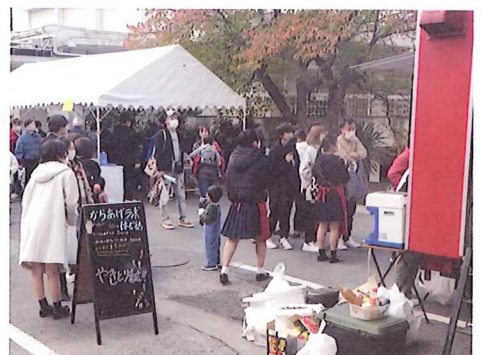
フード販売もキッチンカーも人気！