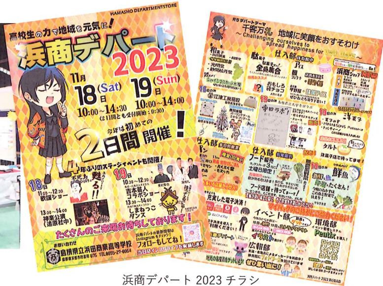
浜商デパート 2023 チラシ