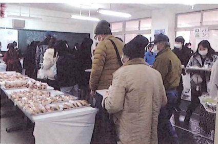
パン店舗は多目的教室へ移動しても大盛況！