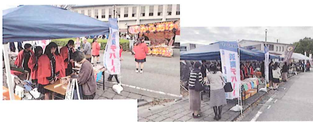
みすみフェスティバル 2023