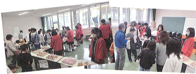
リハビリテーションカレッジ島根 学園祭

浜商デパート開催前後には、地域のイベントに参加し、デパートでの学びをさらに生かしています。