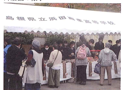
大人気の鮮魚・野菜店舗