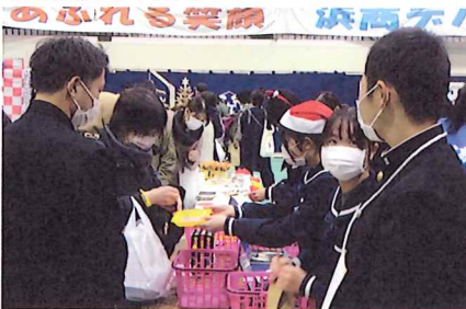
日ごろ学んでいるビジネスマナーを発揮し、来場されたお客様に精一杯のおもてなし