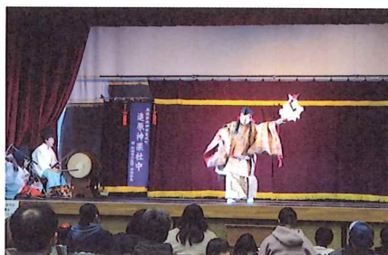
4年ぶりのステージイベントも開催！