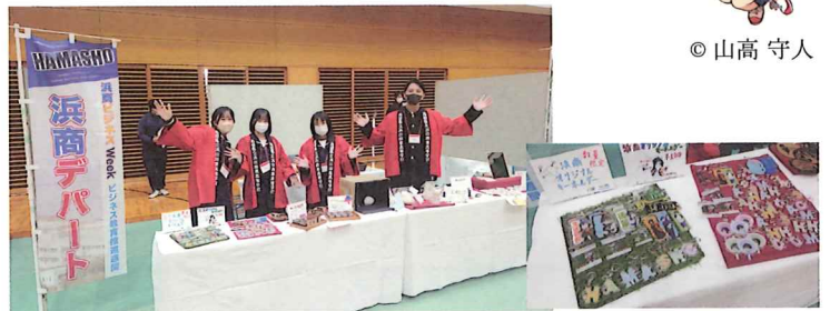
HAMADA 教育魅力化フェスタ 2023