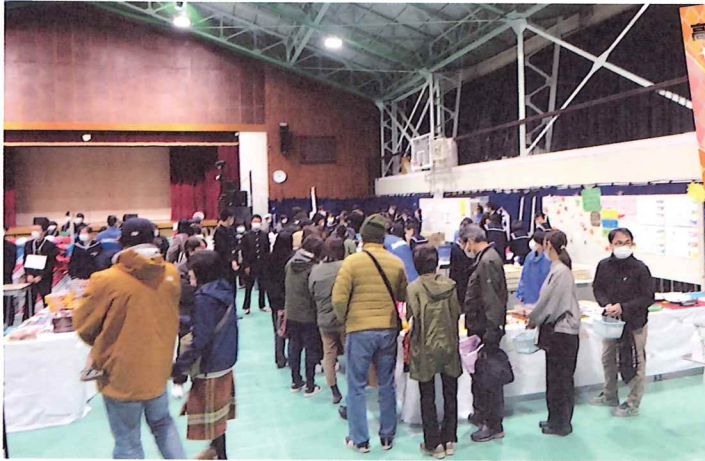
2日間で2,000人ものお客様が来校され、開店と同時に大賑わい！